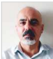
Acı Veren Geçmişimizden Kurtulmak Mümkün mü?