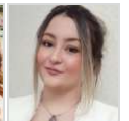
İş Kazası Nedir?