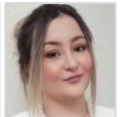
Araç Değer Kaybı Tazminatı