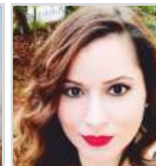
Çocuğunuza Sorumluluk Kazandırmanın Yolları