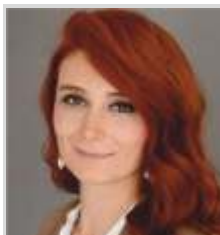
'SEN BEN LENİN' Filmine Dair