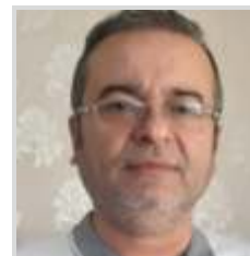
Devlet Ana (Bilgi Arkeolojisi)